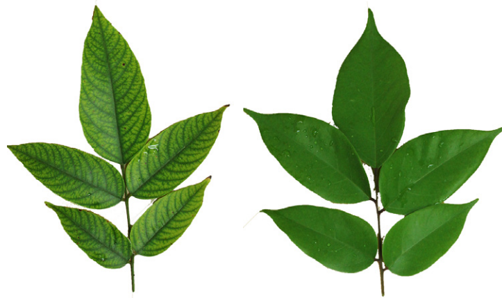
Les feuilles de l'arbre (Averrhoa carambola) avec des insuffisances (à gauche) et des suffisances (à droite) en absorption des éléments nutritifs du sol.